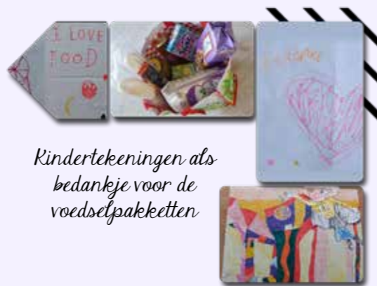
Kindertekeningen als bedankje voor de voedselpakketten

Het is mooi om te zien dat we dit als gemeente zo vol houden met elkaar. En de verwachting is dat we ook nog wel een tijd op deze manier behulpzaam mogen zijn. Iedereen levert op zijn of haar manier een bijdrage. Sommigen brengen regelmatig een pakket, anderen zorgen voor een enveloppe met inhoud zodat wij daar pakketten van kunnen kopen. Weer anderen sturen we een "Tikkie" voor de boodschappen die wij namens hen gedaan hebben. Weer anderen maken geld over naar de penningmeester van de kerk en dat gaat dan weer rechtstreeks naar het buurthuis. Kortom: er wordt op veel manieren geholpen