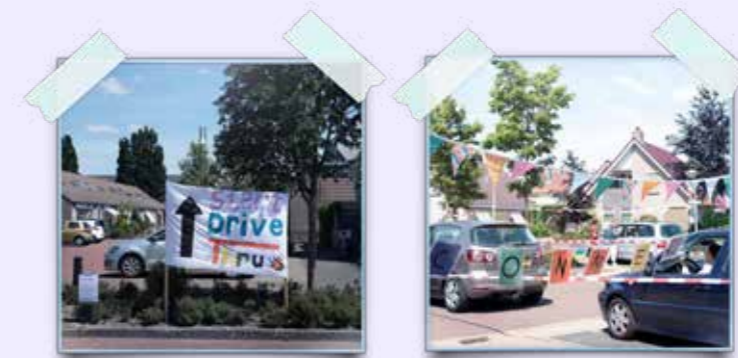
impresie Pinksterfeest in Elburg

Veranderen vraagt om loslaten en loslaten is moeilijk. Het is dan ook niet een proces dat we moeten overhaasten, maar wel iets wat we als gemeente bereid moeten zijn te doen. Door de jaren heen zijn we zo vertrouwd geraakt met onze eigenheid, identiteit en authenticiteit als gemeente, dat zij wellicht te fundamenteel is geworden. Onze eigenheid heeft (onbewust) een hogere plaats gekregen dan waarvoor we ten diepste aan elkaar gegeven zijn. De coronacrisis brengt dat nu aan het licht. Ze daagt ons uit om weer op zoek te gaan naar de essentie van ons samen-zijn en de vorm waarin zij tot nu toe gegoten is te toetsen. Het verdriet van het loslaten dat daarbij komt kijken mogen we bij God brengen en belijden. Zodat we vervolgens weer op weg kunnen gaan, in navolging van Jezus met Zijn krachtige belofte: 'En houd dit voor ogen: ik ben met jullie, alle dagen, tot aan de voltooiing van deze wereld'. Laten we vanuit dit vertrouwen samen op weg gaan.