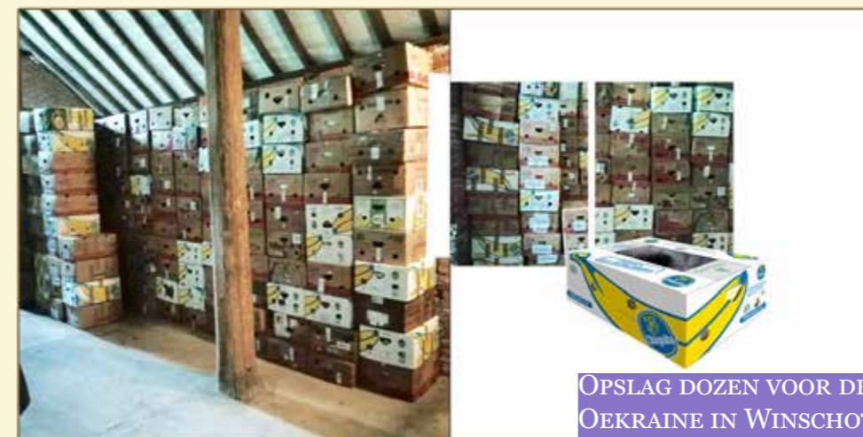
OPSLAG DOZEN VOOR DE OEKRAÏNE IN WINSCHOTEN

Op allerlei plekken in Nederland staan stapels dozen met kleding, schoenen en textiel te wachten tot ze naar onze broeders en zusters in Oekraïne vervoerd kunnen worden. Bijvoorbeeld in Winschoten, waar gelukkig iemand van de gemeente een grote schuur heeft. Op het moment dat we dit schrijven (15 juni 2020) is het nog niet mogelijk om goederen naar Oekraïne te transporteren. We laten het weten zodra het weer kan. Let ook op mededelingen in uw gemeenteblad.