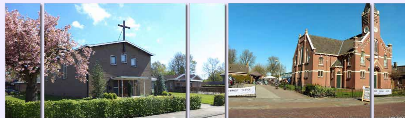
kerkgebouw VEG Bergum

Hoe komen we straks allemaal weer samen met alle opgedane ervaringen in deze afgelopen maanden, maar ook met datgene waaraan we geleden hebben? Wat betreft de gemeente opbouw denk ik dat ik daarmee straks opnieuw zal moeten beginnen. Daarbij hoop ik dat het ons alleen maar meer bewust heeft gemaakt van datgene waarin we geloven, waarvoor we willen staan en van wat we willen behouden. Juist omdat we meer dan ooit mogen beseffen: het samenkomen als gemeente is nooit vanzelfsprekend, maar een voorrecht!