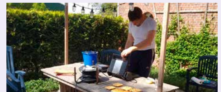
Lekkere wafels werden op Hemelvaartsdag aan huis gebracht van gemeenteleden, gasten en burens. De opbrengst was voor het goede doel.

We zijn verheugd dat zoekende, jonge mensen de weg vinden naar de gemeente, ondanks coronabeperkingen. Mogen we als kerk een corona-lichtkring zijn voor onze eigen mensen en voor hen die onderweg zijn.