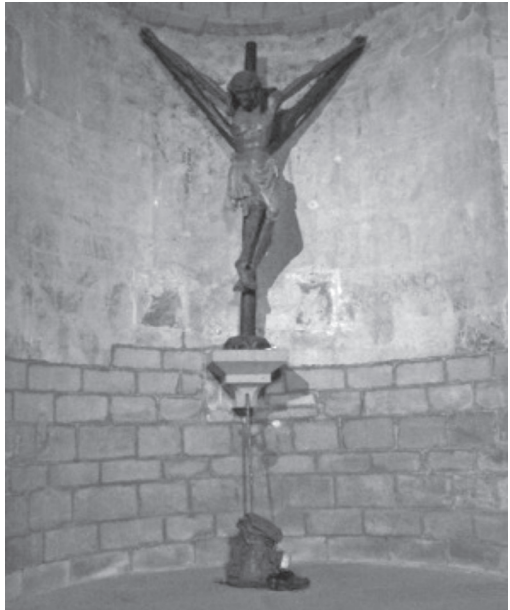
Kruis in het liturgisch centrum in een kerk in Puente la Reina te Spanje

* Ultreia is een geschreven elektronisch uitgave van het Vlaams en Nederlands Sint Jacobsgenootschap. Een vereniging van pelgrims die naar Santiago de Compostella gaan (of hebben) lopen of fietsen.