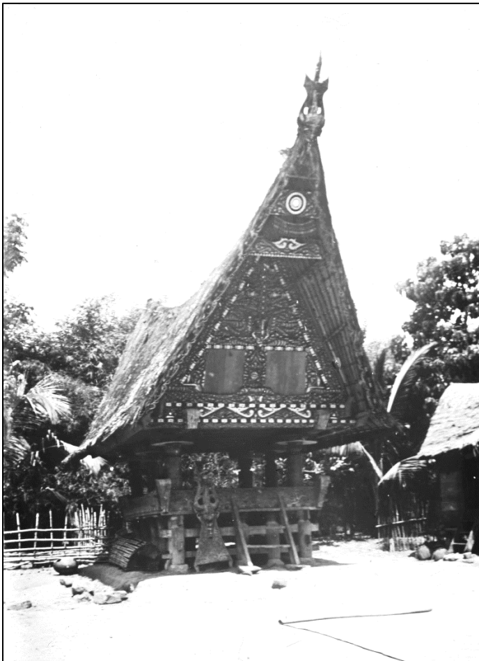
Collectie glasdia's, Sopo (rijtschuur)

Mietus: “Het was aanschouwelijk onderwijs en er werd heel beeldend verteld over het leven en de religie van de Bataks.” Ook de genoemde glasdia’s fungeerden op deze wijze, als aanjager van betrokkenheid bij de zending. “Deze glasdia’s werden op het witte doek getoond met behulp van een zogenoemde ‘toverlantaarn’ of ‘projectielantaarn’. Het zijn heel bijzondere dia’s, die ik allemaal heb opgenomen in mijn boek. Het leuke is, ze vertellen het verhaal van een zendingsreis. Eerst zie je stoomboten op weg naar Nederlands-Indië. Het eiland Samosir komt dan steeds dichterbij. En vervolgens gaat de wereld van Sumatra als een panorama open.”