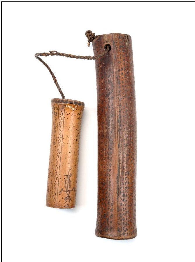
Wichelkoker. Foto: Irene de Groot, Wereldmuseum Amsterdam, TM-2761-594

Een eerdere, kortere versie van dit artikel verscheen in april 2024 in het Friesch Dagblad.