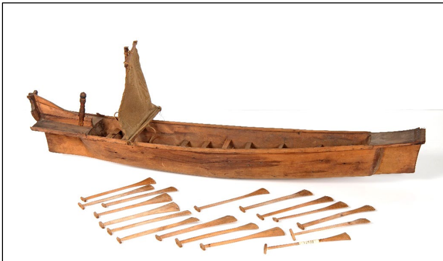
Model van een Solu (boot voor 16 roeiers). Foto: Irene de Groot, Wereldmuseum Amsterdam, TM-2761-807

Het Bataks Museum in de Weteringkerk herbergde vele, vaak kunstige voorwerpen. Zending Eigenbrod verzamelde die ter plaatse, en betaalde er flink voor, vertelt Mietus. Het doel van het Amsterdamse museum, waar de voorwerpen terecht kwamen, was de zending tastbaar te maken en zo dichterbij te brengen. „Je kon gemeenteleden laten zien dat de Bataks zich bekeerden en afstand deden van hun religieuze objecten”, legt Mietus uit. „Maar je kreeg ook een beeld hoe mensen daar leefden. Hoe hun boten en huizen eruitzagen. Hoe fraai het weefwerk van de Batakse vrouwen was en hoe kunstig het zilverwerk.”